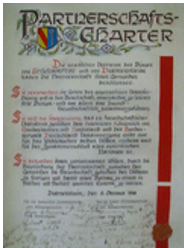
Erstellt am 30.12.2019

Im Jahre 1975 begründeten die Gemeinden Durmersheim und Chennevières s. M. eine Partnerschaft. 1982 verschwisterte sich Chennevières mit der englischen Stadt Littlehampton und 1988 besiegelt auch Durmersheim die Partnerschaft mit Littlehampton, die drei Gemeinden bilden eine Dreieckspartnerschaft.